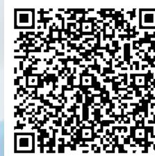
菁英全國賽報名表單