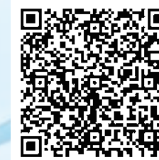
亞洲盃區域賽報名表單